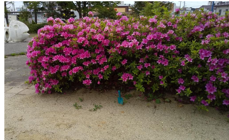
② 砂場横、つつじの木の下 空間線量

50cm 0.04 \mu\text{Sv/h} 5cm 0.04 \mu\text{Sv/h} 土壌測定値 6.31 Bq/kg