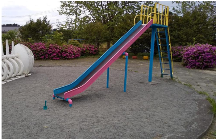
① 砂場、すべり台の下 空間線量

50cm 0.04 \mu\text{Sv/h} 5cm 0.04 \mu\text{Sv/h} 土壌測定値 6.31 Bq/kg