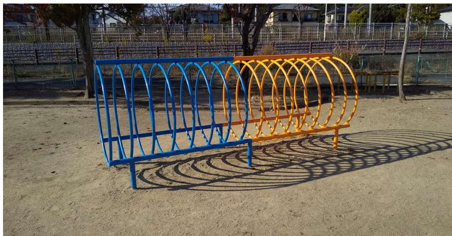
⑧ 輪のトンネルまわり