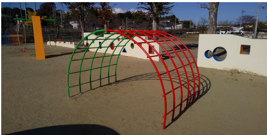
⑥ たいこ橋(ジャングルジム)下