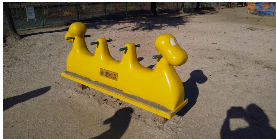
⑨ ゆらゆら宝くじ号まわり